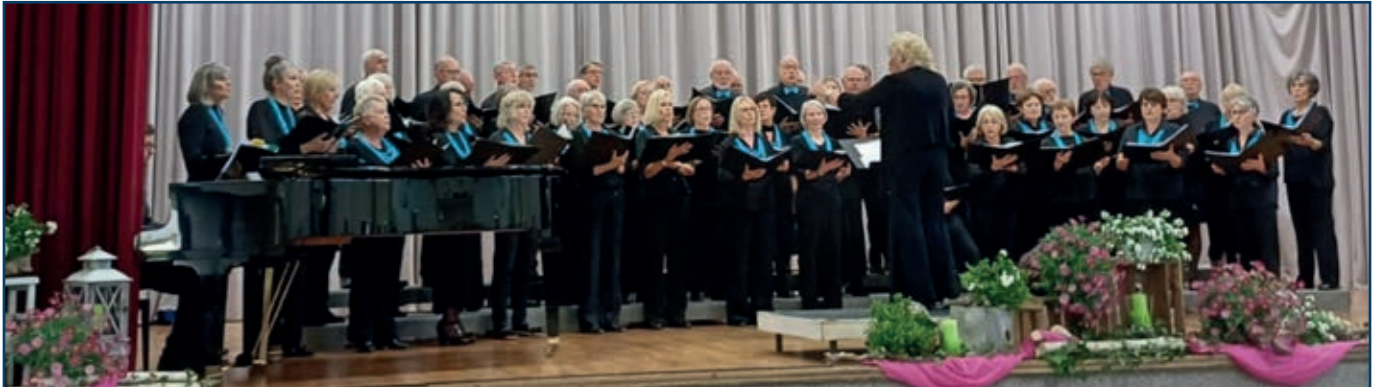
Polizeichor Tübingen in Aktion

Am Samstag, den 2. Mai 2026, hatte der Polizeichor Tübingen wieder zu seinem traditionellen Frühjahrskonzert in die Hermann-Hepper-Halle in Tübingen eingeladen.