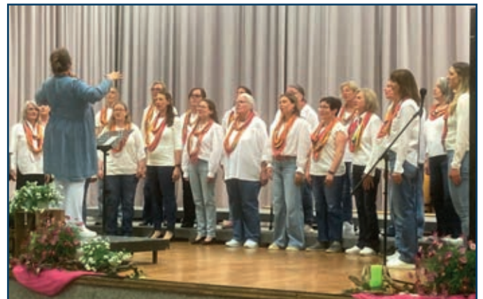
Frauenchor der Münchner Polizei

Den Abschluss bestritt wieder der Tübinger Polizeichor mit den bekannten Liedern „Ich hab am Anzug viele Taschen“, „Ein Freund, ein guter Freund“ und „Wunder gescheh'n“.